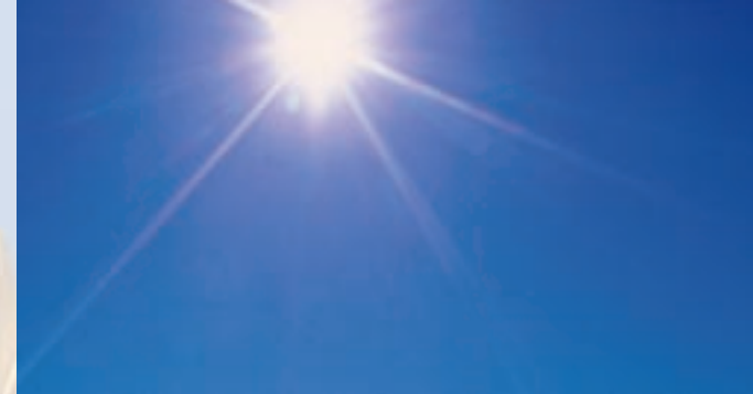
Eine fast unerschöpfliche Energiequelle: Die Sonne stellt keine Rechnung!