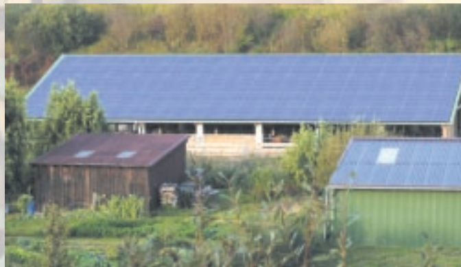
Der neue Stall des Demeterhofes Hiß mit einreuschiertem Solardach.

Die Solaranlagen werden rund um die Uhr überwacht. Zusätzlich prüft unsere Servicemannschaft regelmäßig alle Komponenten vor Ort und führen periodisch Wartungs- und Reinigungsarbeiten durch.